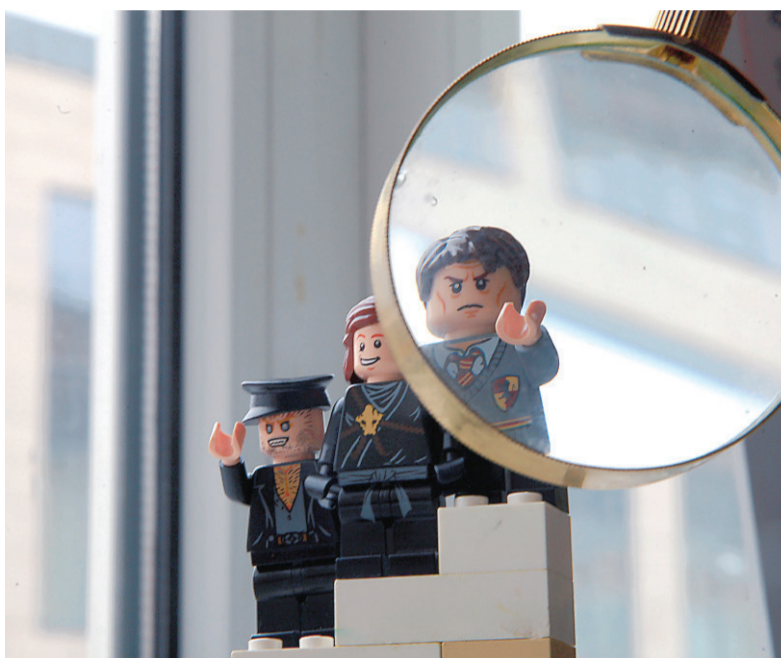
Юристов изучили и расставили по местам