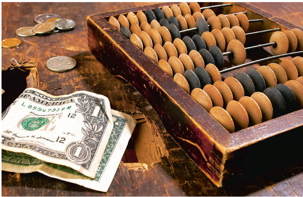
Российские юристы предпочитают зарабатывать по старинке